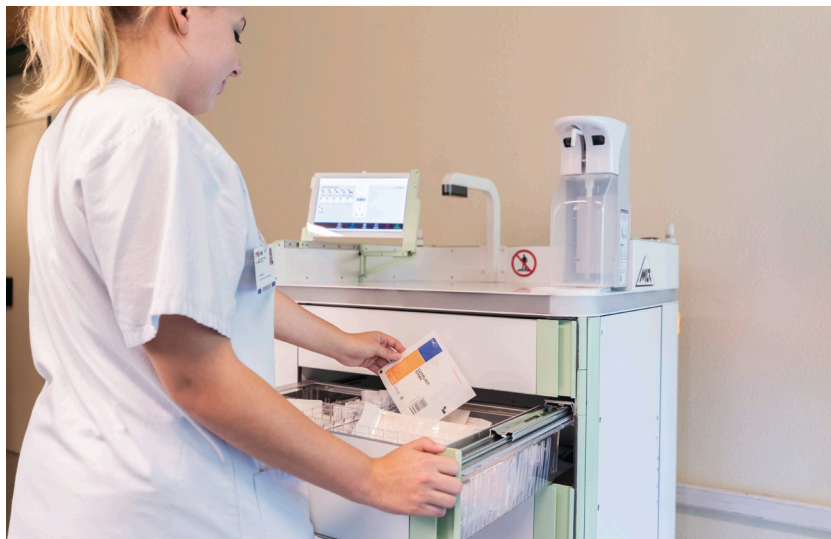
Bild 2 Pflegewagen

Der Pflegewagen ist modular aufgebaut und ist an verschiedene Einsatzorte, wie bspw. Altenheime oder Krankenhäuser, anpassbar. Die Schubladen sind abgeschlossen, solange keine Pflegekraft angemeldet ist.