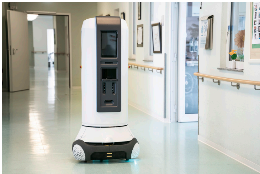
Bild 1 ServiceAssistent

Der robotische Service-Assistent navigiert in Gemeinschaftsräumen von Pflegeeinrichtungen und bietet den Bewohnern oder Patienten Getränke oder Snacks an. Dies entlastet nicht nur das Personal, sondern fördert auch die Selbstständigkeit der Pflegebedürftigen.