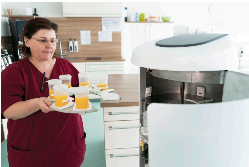
Bild 3 ServiceAssistent

Bis zu 28 Becher oder diverse Snacks finden im Service-Assistenten Platz. Sind alle ausgegeben, fährt der Roboter wieder in die Küche, wo das Personal ihn neu befüllen und mit dem Smartphone wieder in die Gemeinschaftsräume schicken kann.